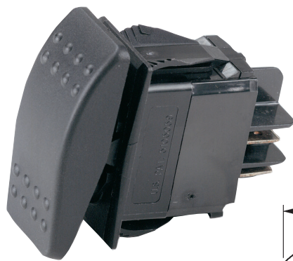
A4030 med A4004 huv